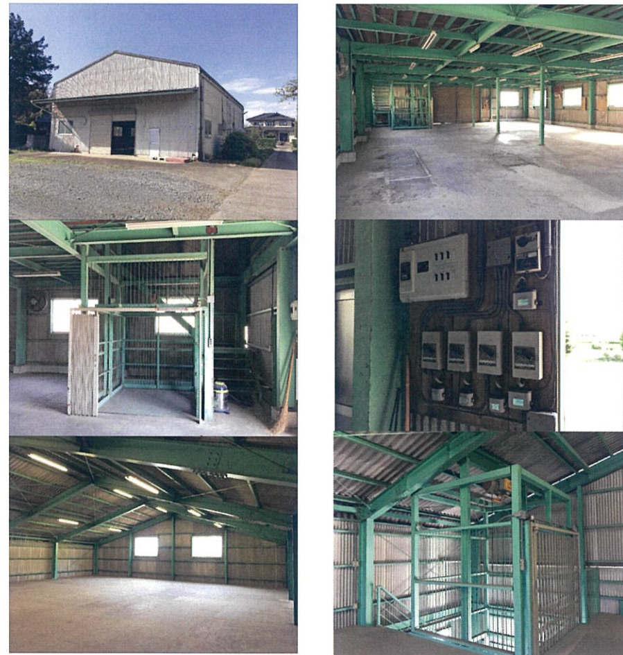
貨物用エレベータ風袋込み1.5t