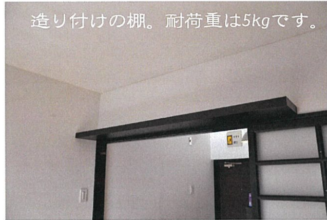
造り付けの棚。耐荷重は5kgです。

黒木調のキッチンパネルが高級感を演出。 黒密ルミのある落ちついた雰囲気。 落ちついたパネルが高級感を演出。 落ちついたパネルが高級感を演出。