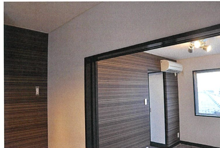
シックで高級感のあるアクセントクロスで 落ち着いた居住空間を演出（キッチンから連続） アルマイトの三方照明がキッチンの雰囲気と調和