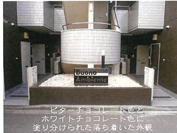
ビターチョコレート色と ホワイトチョコレート色に 塗り分けられた落ち着いた外観

室内照明はすべてLEDで経済的 賃貸マンションらしからぬ 内外装は一見の価値あり！